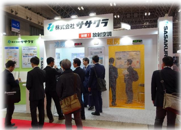
～弊社ブースの様子～